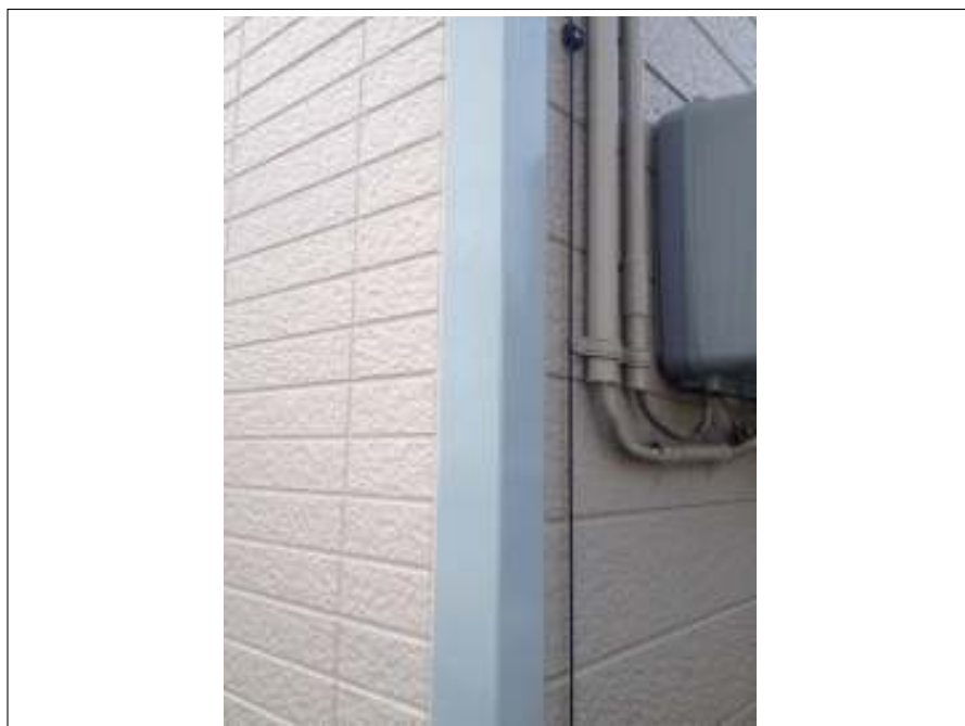
コーナーアクセント