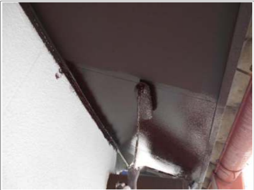
軒天 上塗り（2回目）施工中