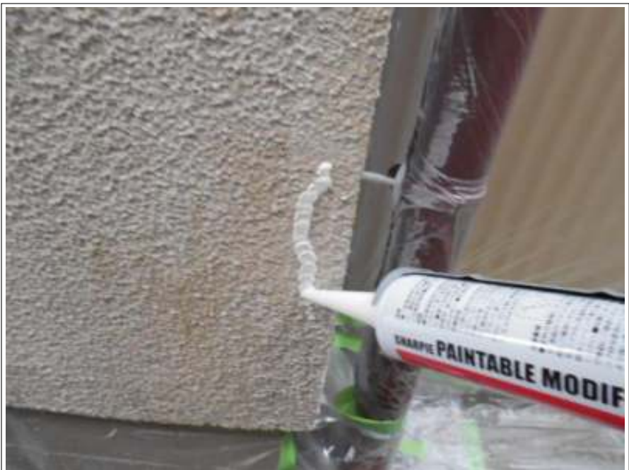
外壁 クラック補修施工中