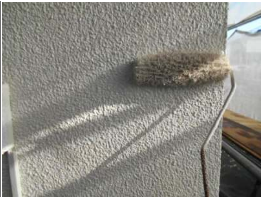
外壁 上塗り施工中