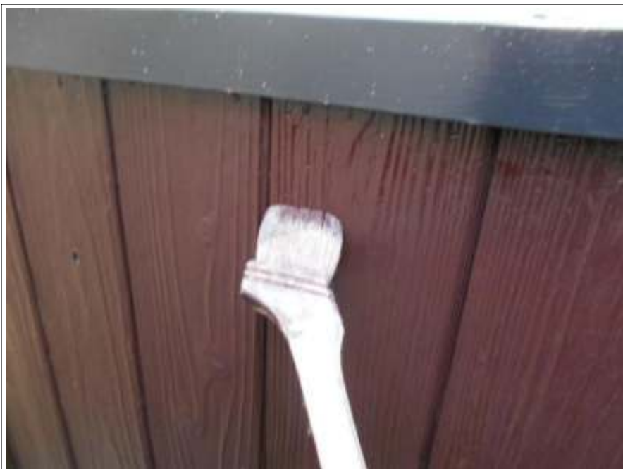
木部 上塗り施工中