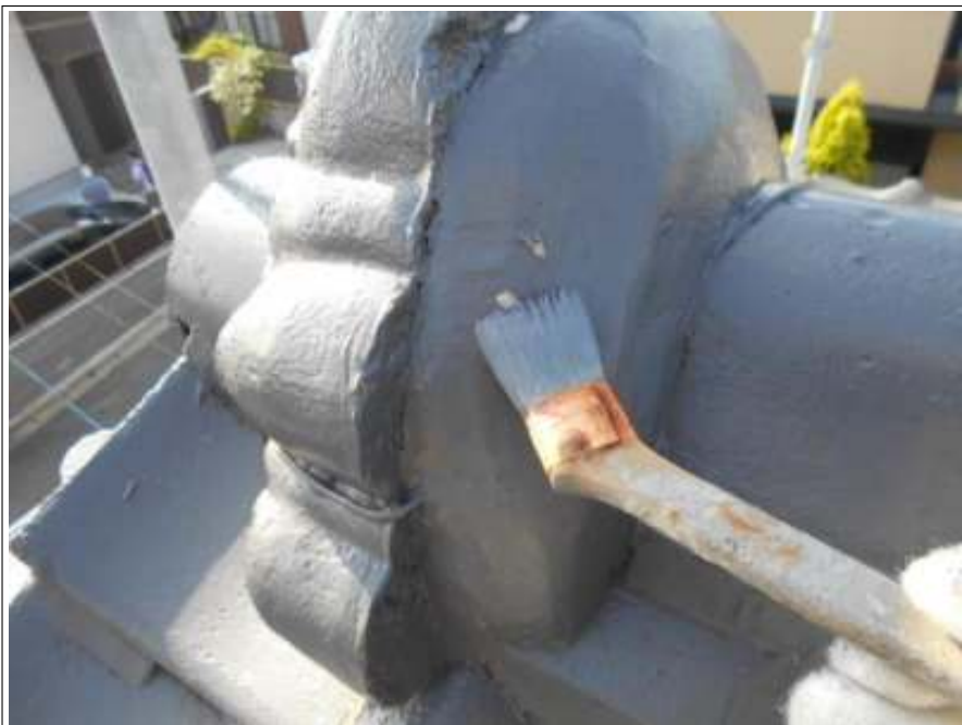
屋根 補修 施工中