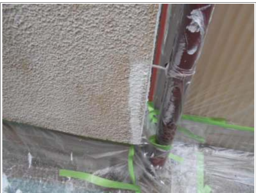
外壁 クラック補修施工後