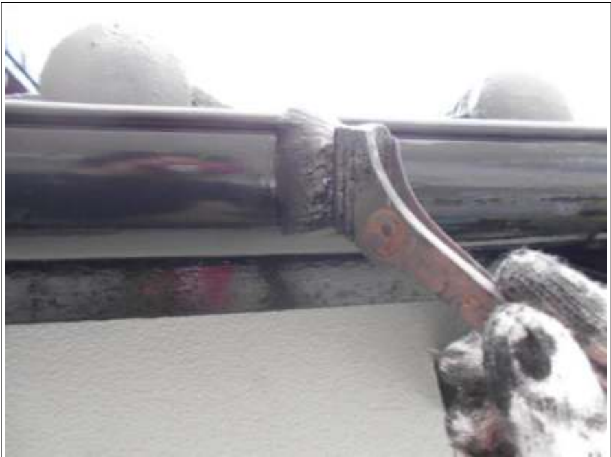
樋 上塗り（2回目）施工中