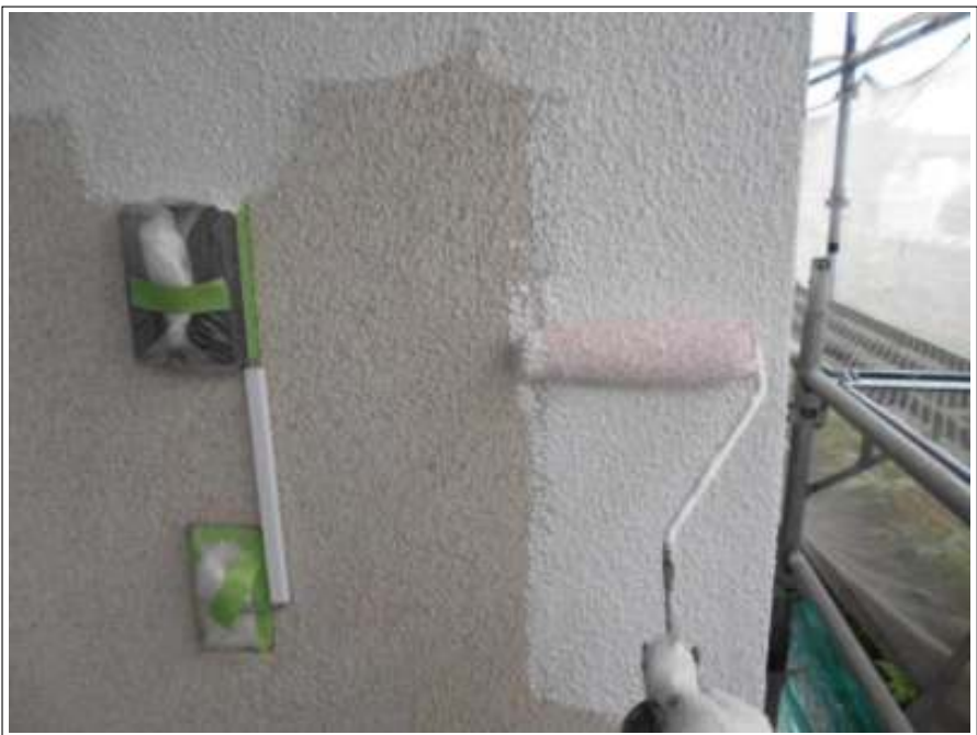
外壁 下塗り施工中