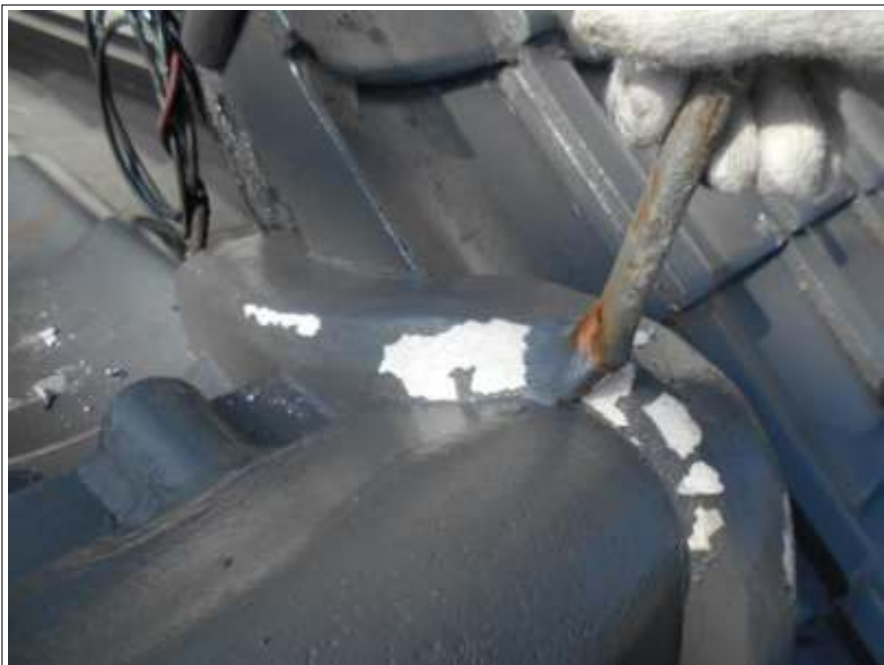
屋根 補修 施工中