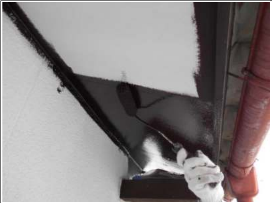
軒天 上塗り（1回目）施工中