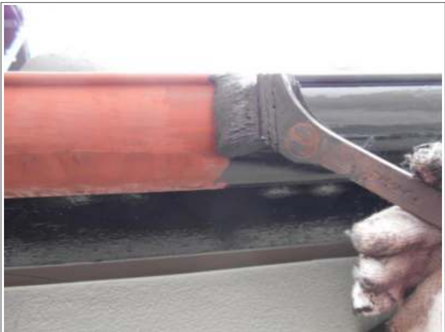
樋 上塗り（1回目）施工中