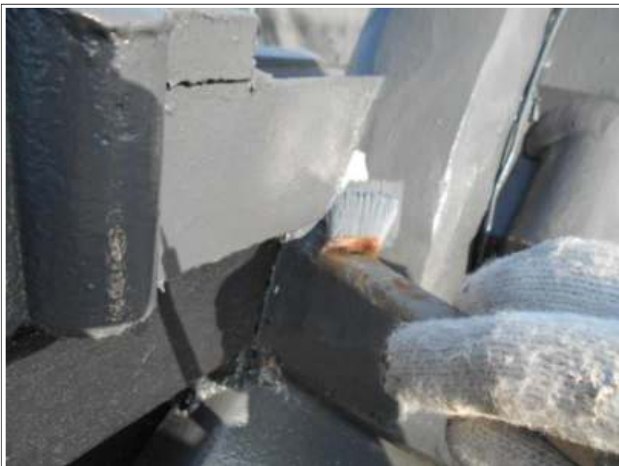
屋根 補修 施工中